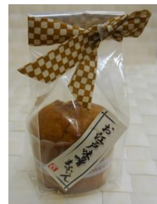
▲学科教員による試作品（イメージ）

東京の地域特産品である“江戸甘味噌”を使うという発想の素晴らしさが審査員の目に留まり、最優秀賞に選ばれました。