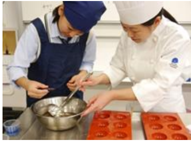
▲製菓学科での製品化（写真は前回のもの）

目白大学短期大学部製菓学科主催「スイーツアイデアコンテスト」につきまして、受賞者と製菓学科教員による「製品化」および「表彰式」「学園祭での販売」を予定しております。